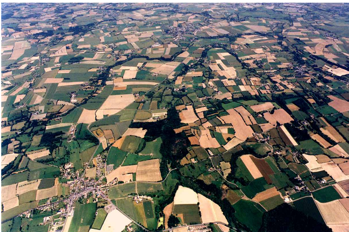
Figure 2 : Les cours d'eau sont signalés par les boisements (haies, bosquets) de part et d'autres, site de Pleine-Fougères de la zone atelier Armorique.