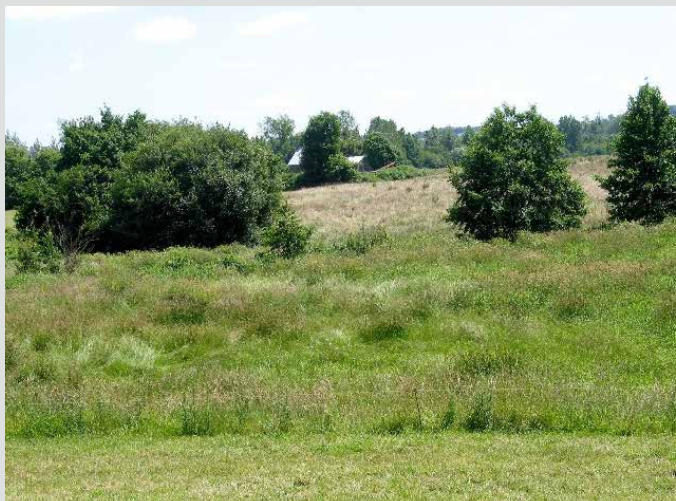
b) Prairie humide de fond de vallée.