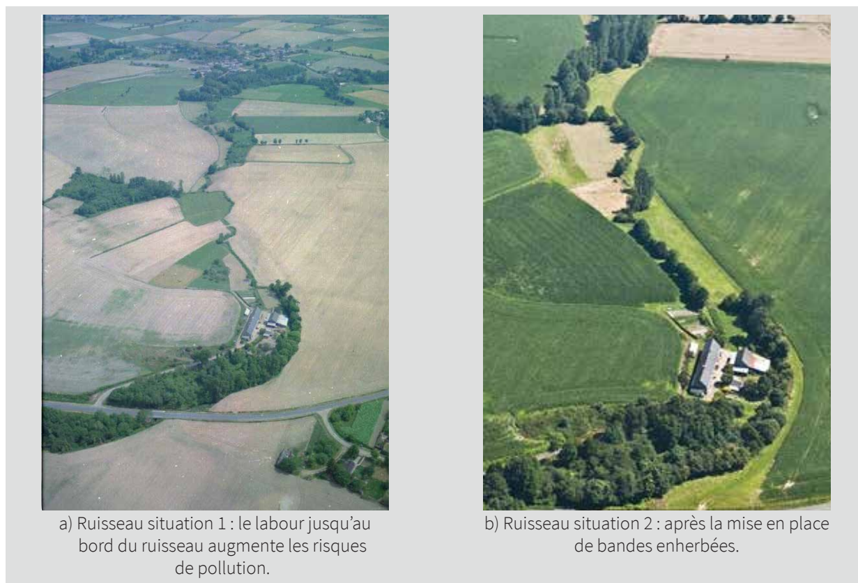
Figure 5 : Environnement d'un cours d'eau avant et après la mise en place de bandes enherbées

Dans ces zones régulièrement engorgées d'eau, en alternance avec des périodes plus sèches, se déroulent des processus de dénitrification. Les nitrates peuvent être transformés en azote dans l'air. Ce sont donc des zones essentielles pour maintenir la qualité de l'eau. L'implantation de bandes enherbées le long des cours d'eau est une obligation de la Politique Agricole Commune (Figure 5). Elles ont essentiellement un effet positif vis-à-vis des eaux qui ruissellent. Elles évitent aussi les épandages à proximité immédiate du cours d'eau.