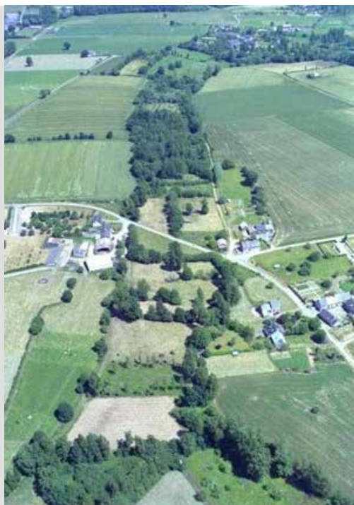
a) Talus de ceinture de bas fond qui délimitent la zone humide de part et d'autre du cours d'eau.

En s'infiltrant dans le sol, l'eau de pluie peut atteindre les nappes phréatiques qui alimentent les sources et les puits. Elle peut y rester quelques dizaines d'années. L'eau qui s'infiltre rencontre aussi, souvent dans les massifs anciens, des couches imperméables et circule alors sous la surface du sol, vers le ruisseau. Quel que soit leur parcours, les eaux circulant dans le sol s'enrichissent en éléments solubles. Quand elles atteignent le cours d'eau, celui-ci s'enrichit des éléments qu'elles contiennent et notamment des polluants. Une bonne connexion avec la trame verte, peut permettre par exemple que les eaux souterraines rencontrent des haies dont les arbres pompent les nitrates pour leur croissance ainsi que des zones humides, notamment dans les bas-fonds (Figure 4). Cela contribue à limiter les risques d'eutrophisation.