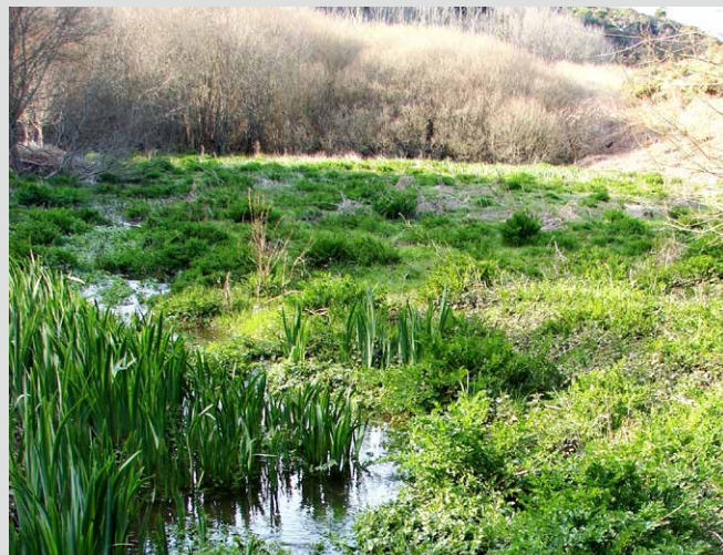
c) Prairie de bas-fond inondée. Le talus de ceinture, au fond, délimite clairement la zone humide du versant.