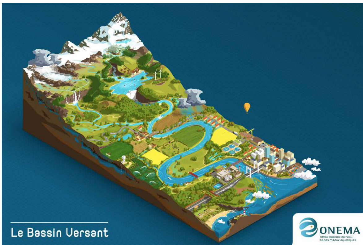
Figure 1 : Un bassin versant est une portion de paysage où le relief permet à l'eau de pluie de ruisseler sur une pente pour aller alimenter un cours d'eau. Ce point de convergence de l'écoulement de l'eau (exutoire) peut également se traduire par un lac ou la mer. (Source image : Matthieu Nivesse, ONEMA).