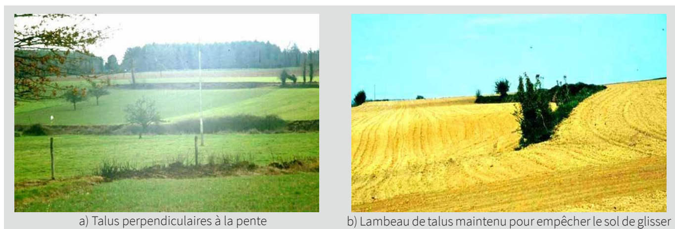
Figure 3 : Les talus perpendiculaires à la pente (photo a) diminuent le ruissellement, donc la vitesse d'arrivée de l'eau dans les cours d'eau et limitent l'érosion des sols. Mais s'il ne reste plus qu'un lambeau de talus (photo b), il concentre l'eau qui va ruisseler à partir des extrémités.

Le bocage joue un rôle important dans la limitation du ruissellement, qui est aussi la cause première de l'érosion des sols. Les talus, lorsqu'ils sont perpendiculaires à la pente (Figure 3), arrêtent l'eau qui ruisselle et les particules qu'elle transporte. Les fossés favorisent la canalisation de l'eau. Une bonne connectivité du réseau est indispensable pour avoir des talus/haies qui freinent le ruissellement et d'autres, dans le sens de la pente qui canalisent l'eau.