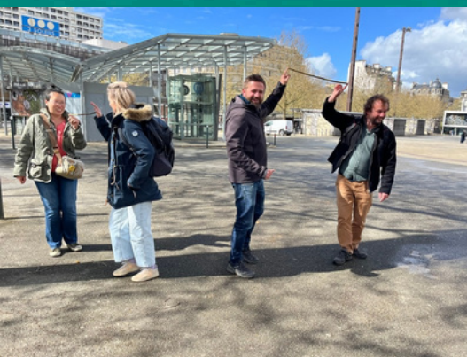
Séminaire de janvier 2026

Journée de valorisation des résultats du projet